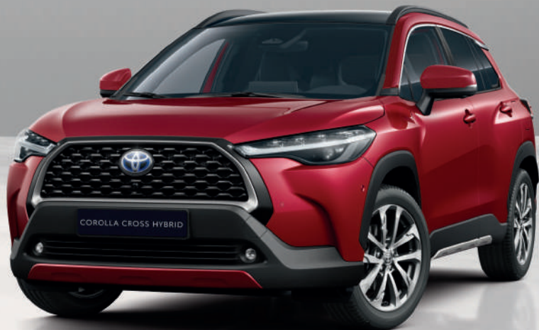
Opciones de colores monotono de Corolla Cross